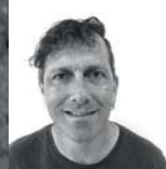
Stefan Rehmann Bau