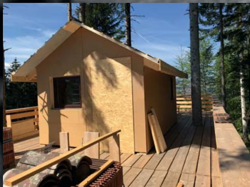
Das Baumhaus im Rohbau

Das Baumhaus kann während dem Köhlerfest besichtigt werden. Lassen Sie sich von der Qualität des Hauses überzeugen.