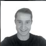
Noel Höner Bau