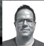
Marco Zaugg Events / Helfer